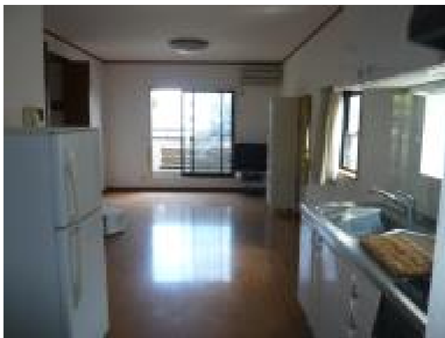
2階リビングダイニングキッチン